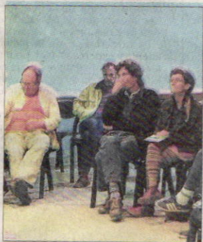
Quelques-uns des participants à la veillée, organisée par la toute jeune association Apuysculture.